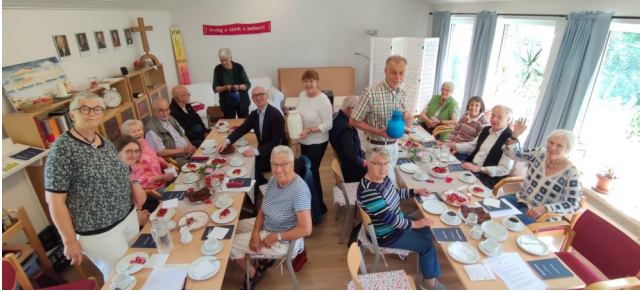
beim Gemeindenachmittag, hier gute Stimmung im Juni 2025